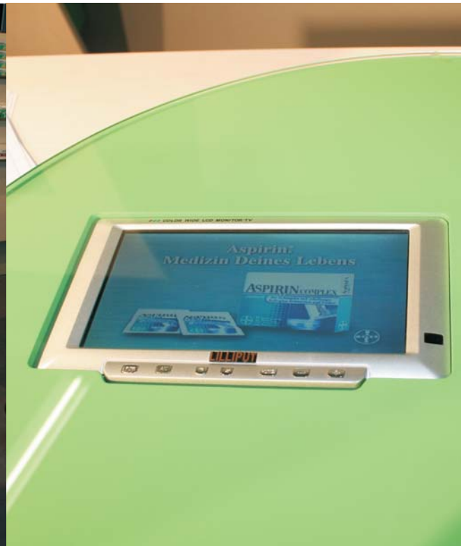
Detailansicht Display im Zahlsteller